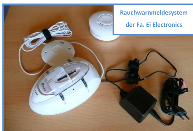
Rauchwarnmeldesystem der Fa. Ei Electronics

Beispiel: Der Rauchwarnmelder im Kinderzimmer des Erdgeschosses schlägt Alarm. Das Signal wird per Funk in die 1. Etage zur Blitzlampe im Elternschlafzimmer übertragen. Die hörgeschädigten Eltern werden sofort wach und können ihr Kind retten.